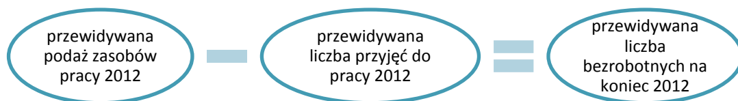
Schemat 1. Sposób prognozowania stanu bezrobocia na poziomie wojewódzkim na koniec 2012 roku

Opracowanie Sedlak & Sedlak na podstawie danych MPiPS