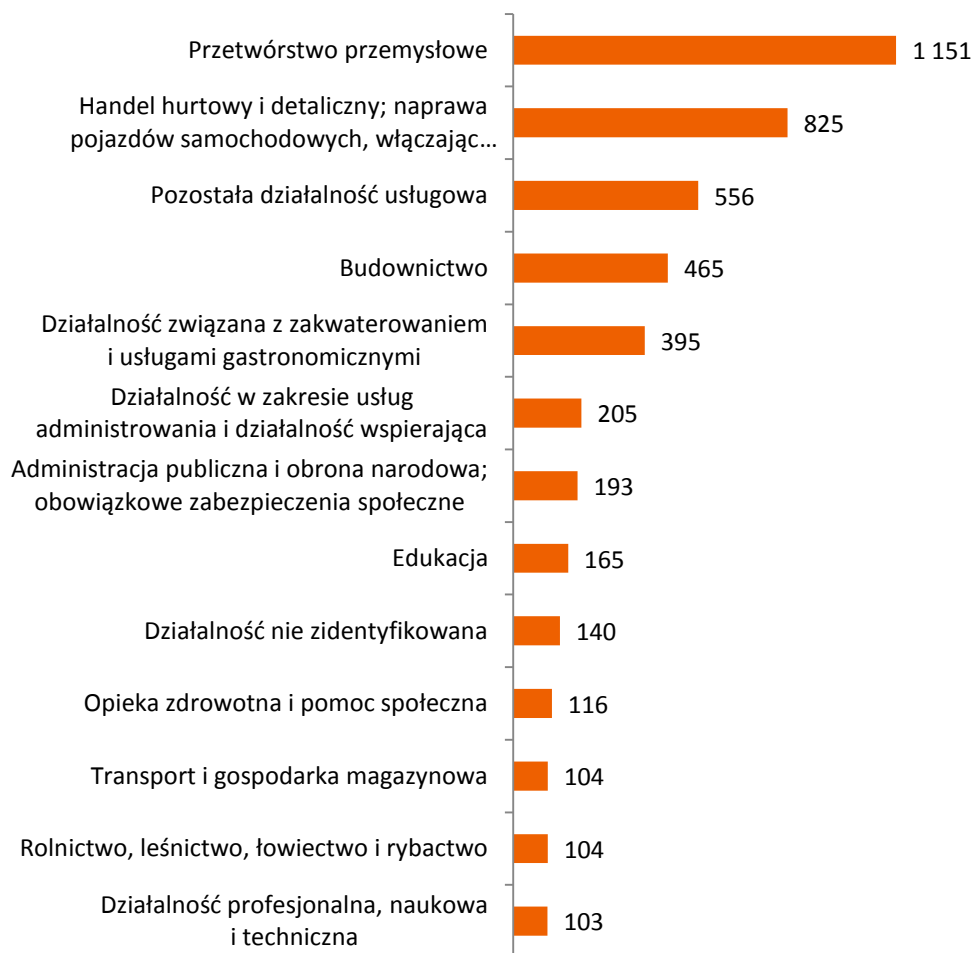
Wykres 2. Bezrobotni zarejestrowani w 2011 roku według rodzaju działalności ostatniego miejsca pracy*

*uwzględniono sekcje PKD, w których zarejestrowało się 100 osób i więcej